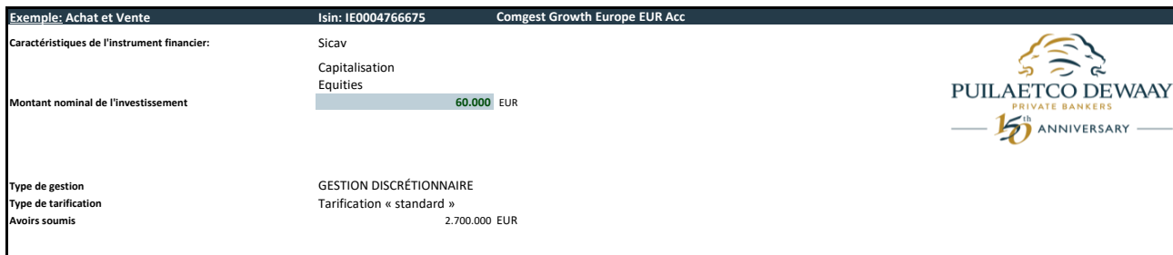
Illustration des coûts et charges liés à la transaction